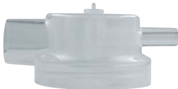
Absaugdeckel mit 15mm I.D. Anschluss REF 30-56-001