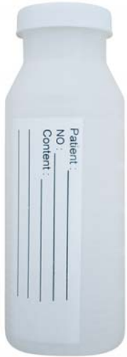
250ml Behälter für Erwachsene, mit Verschlussdeckel REF 30-56-250