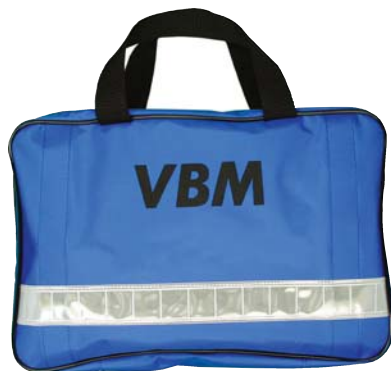
Tasche passend für Pumpe, Kanister, Absaugkatheter REF 30-64-000