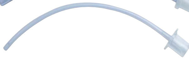
Absaugkatheter, klein, Ch 14 REF 30-57-305