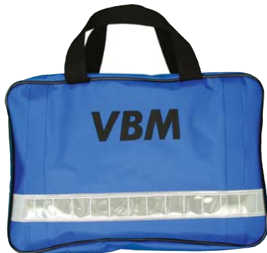
Sac, pour la pompe, les flacons et les cathéters d'aspiration REF 30-64-000