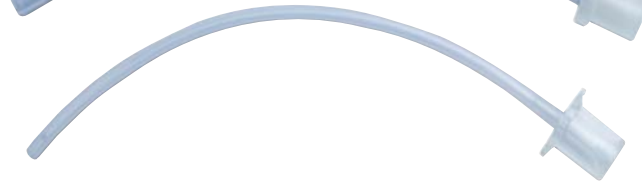
Cathéter d'aspiration, petit, Ch 14 REF 30-57-305