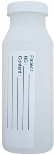
Flacon de 250ml pour adultes, avec couvercle REF 30-56-250