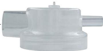
Couvercle pour aspiration avec connexion de 15mm D.I. REF 30-56-001