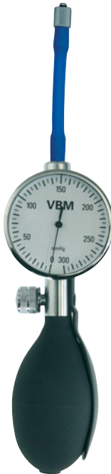
Manometer 300 mmHg mit Handgebläse, Ablassventil und männlichem Luer Lock Konnektor REF 51-09-666