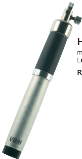
Handpumpe mit Ablassventil und männlichem Luer Lock Konnektor REF 51-30-000