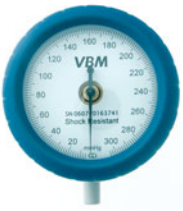
Manometer 300 mmHg schockresistent REF 34-17-300