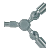
Dreivegehahn mit zwei männlichen und einem weiblichen Luer Lock Konnektor REF 51-02-000