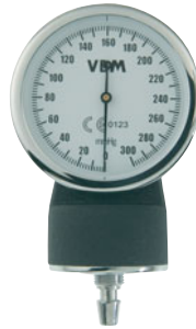
Manometer 300 mmHg REF 20-16-300