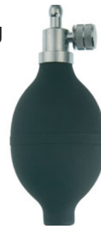
Handgebläse mit Ablassventil REF 51-10-666