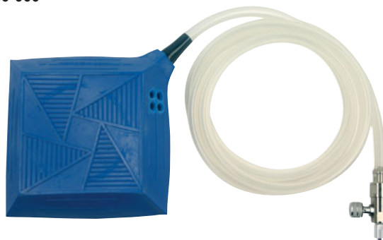
Fußpumpe mit 2 m Silikonschlauch, Ablassventil und männlichem Luer Lock Konnektor REF 51-20-000