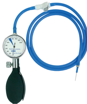
Manometer mit 1 m Verbindungsschlauch REF 21-95-300