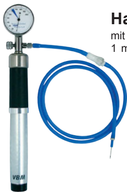
Handpumpe mit Manometer und 1 m Verbindungsschlauch REF 21-95-350